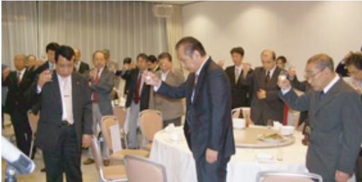
東日本大震災犠牲者への黙祷と献杯