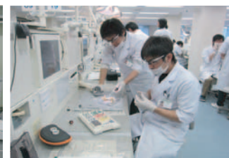
歯科補綴学インプラント実習