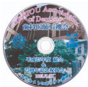
記念誌同封DVD(赤澤征夫氏制作)