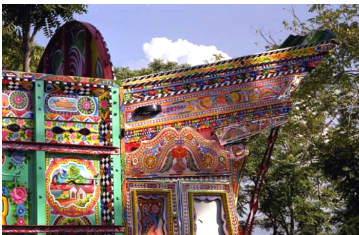
(写真 2-3) 運転席にせり出した飾り部分の横

イスラマバードの近郊にトラックの改造と化粧をしている工場があり、そこを訪れてみた。作業中のトラックが数台あって、その写真を撮らせてもらった。