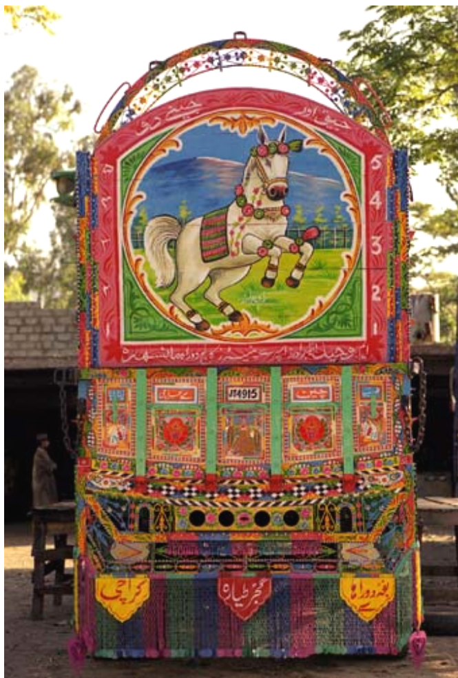
(写真 2-5) トラックの後部。

聞けばパキスタンのトラック野郎は本体より車体の改造と塗装にお金をかけるらしい。工場には図柄の見本が数多くあって、その中から決めることになるが、中には自分で絵柄を用意してくる人もいるとの事である。