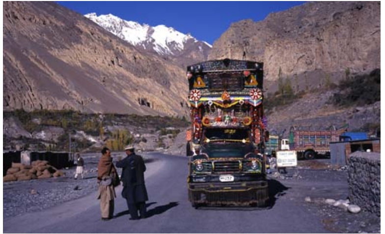
(写真 2-2) カラコルムの中国国境近くで入国審査待ちのトラック野郎。