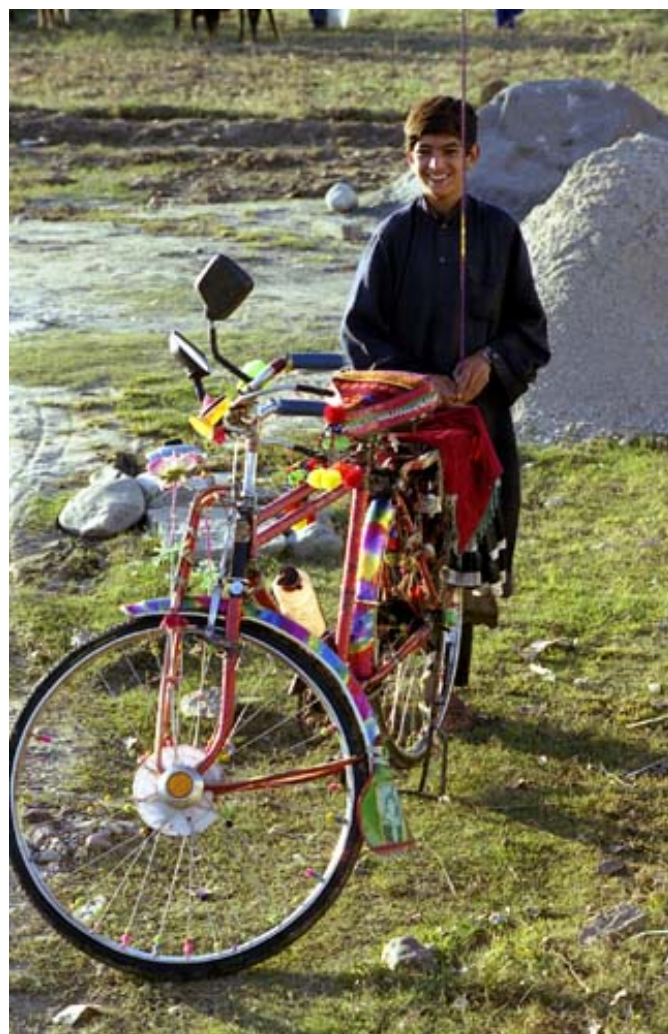
(写真 2-7) 少年と自転車。