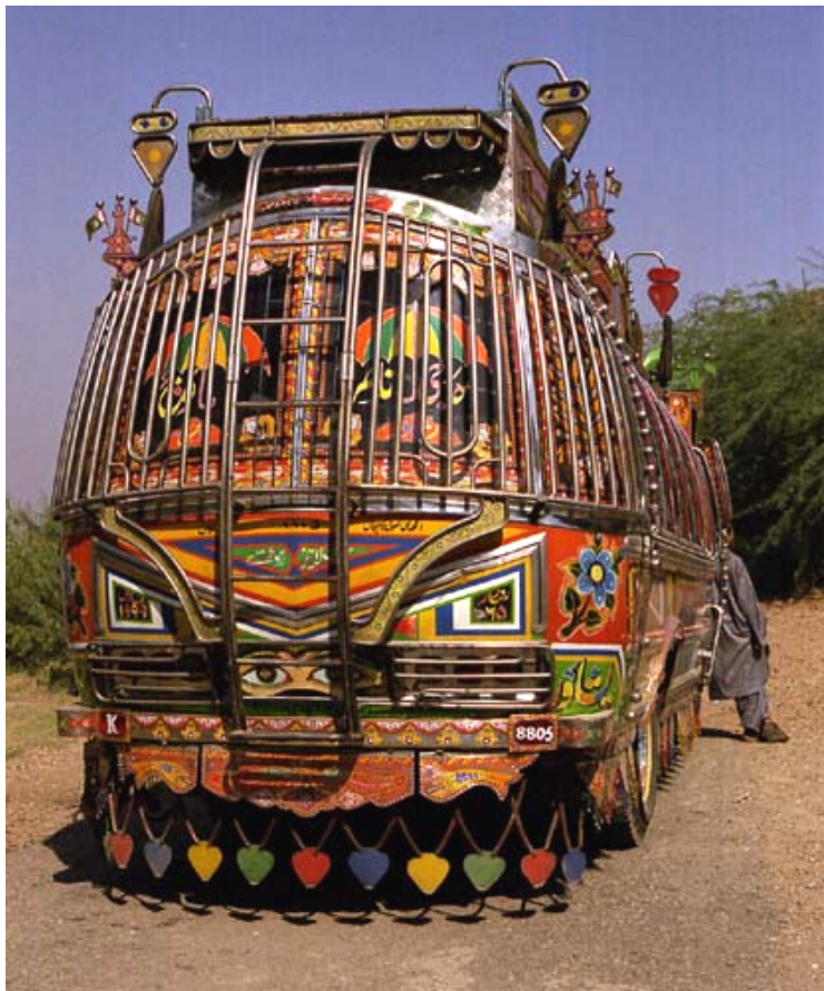
(写真 2-6) 中にはこんな頑丈に出来ているものもある。

通りすがりの畑で自転車に乗った少年に会った。彼の自転車もカラフルに塗装されている。写真に撮るとわざわざ停めて見せてくれた。自慢の自転車なのだろう。パキスタンのトラック野郎は格好良い存在なのだ。