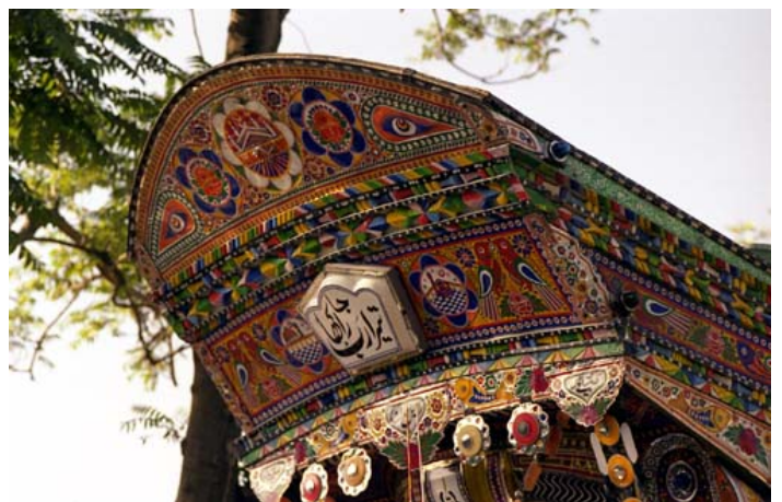
(写真 2-4) 運転席の上部前面。

運転席の上にせり出した飾りの形は駱駝を模しているらしい。往年の駱駝の隊商を引き継いでいる誇りをこれで示